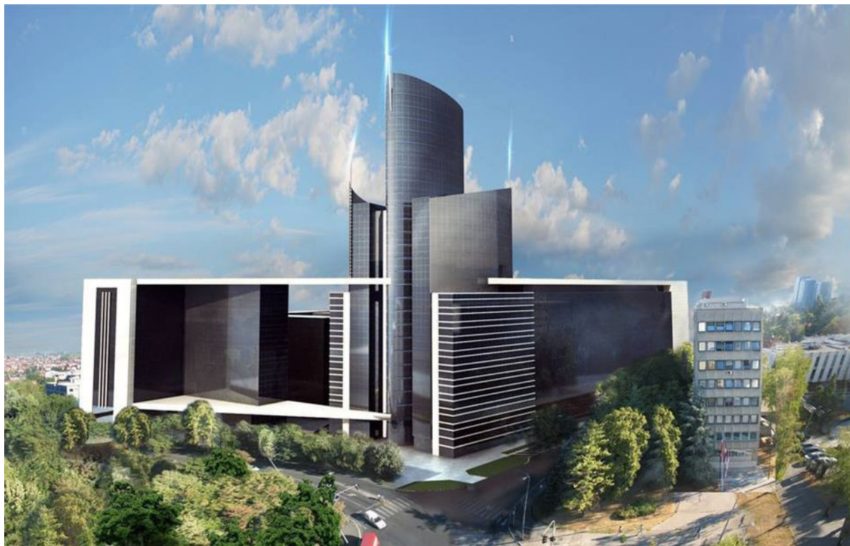
Slika br.6 - plan daljeg širenje objekta Grand Tradea

Ipak uprkos dobrim uslovima, stručnim kadrovima i djelatnošću koja godinama predstavlja unosan posao na našem tržištu,