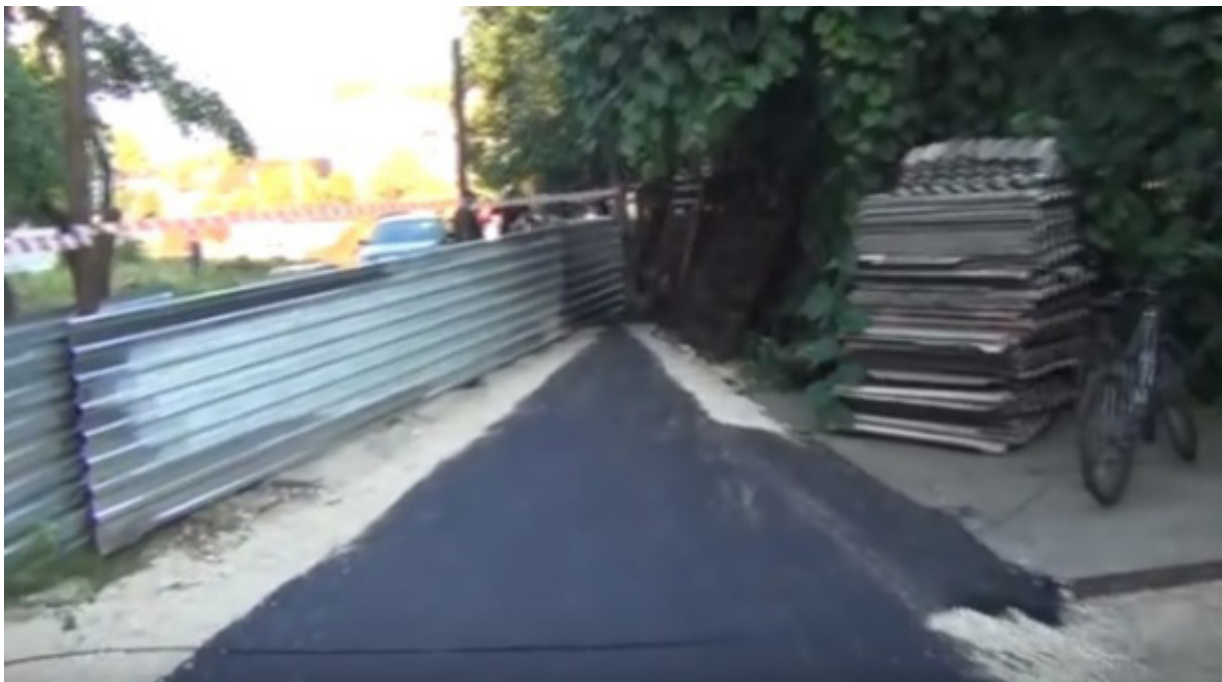
Slika br.5 - Alternativni pristupni put

“Grand trade” objekat izgradio na zakonit način,