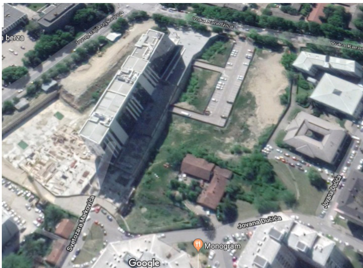
Slika br.4 - Kompleks Grand Tradea

Javni put iz pravca ulice Svetozara Markovića koji je još uvijek vidljiv na fotografiji 1, a koji je ova porodica koristila više od 50 godina, uvršten je regulacionim planom u kompleks parcele koja je dodjeljena Grand Tradeu. Porodica Vulić u pismu gradonačelniku Dragoljubu Davidoviću zatražila je da se prilaz njihovim nekretninama obezbijedi iz postojeće ulice Svetozara Markovića, ali su dobili odgovor od strane RUGIP-a krajem 2009. godine da se taj put površine 261 m 2 spaja sa zemljištem koje je u vlasništvu preduzeća Grand Trade.