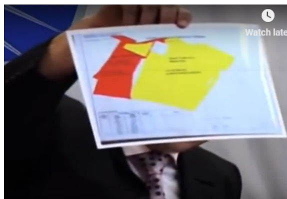
Slika br 8- Press konferencija MUP RS

U septembru te godine dvojica optuženih Cerovac i Bajić priznali su krivicu i sklopili nagodbu sa Tužilaštvom kojim su se obavezali na dalje svejdočenje protiv prvooptuženih u ovom predmetu.